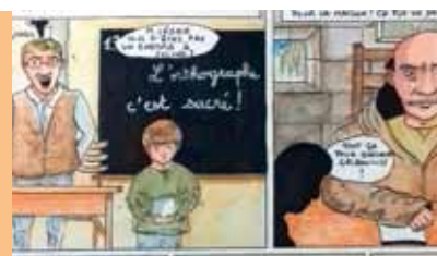
Collège Fernand Léger