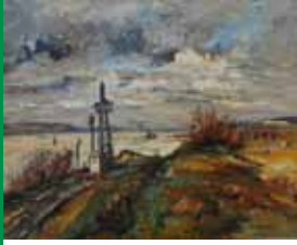
Le pays d'Auge vu par Gervais Leterreux