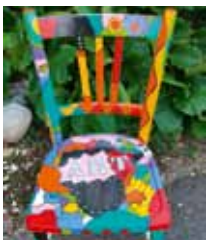
Sèverine Bugna peintre