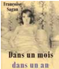
Françoise Sagan, une œuvre et une femme magistrales